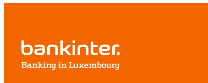
Reproducción en color – negativo