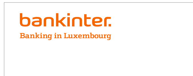
Reproducción en color – positivo