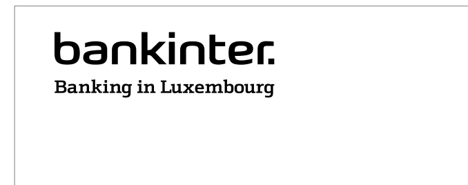
Reproducción en blanco y negro – positivo